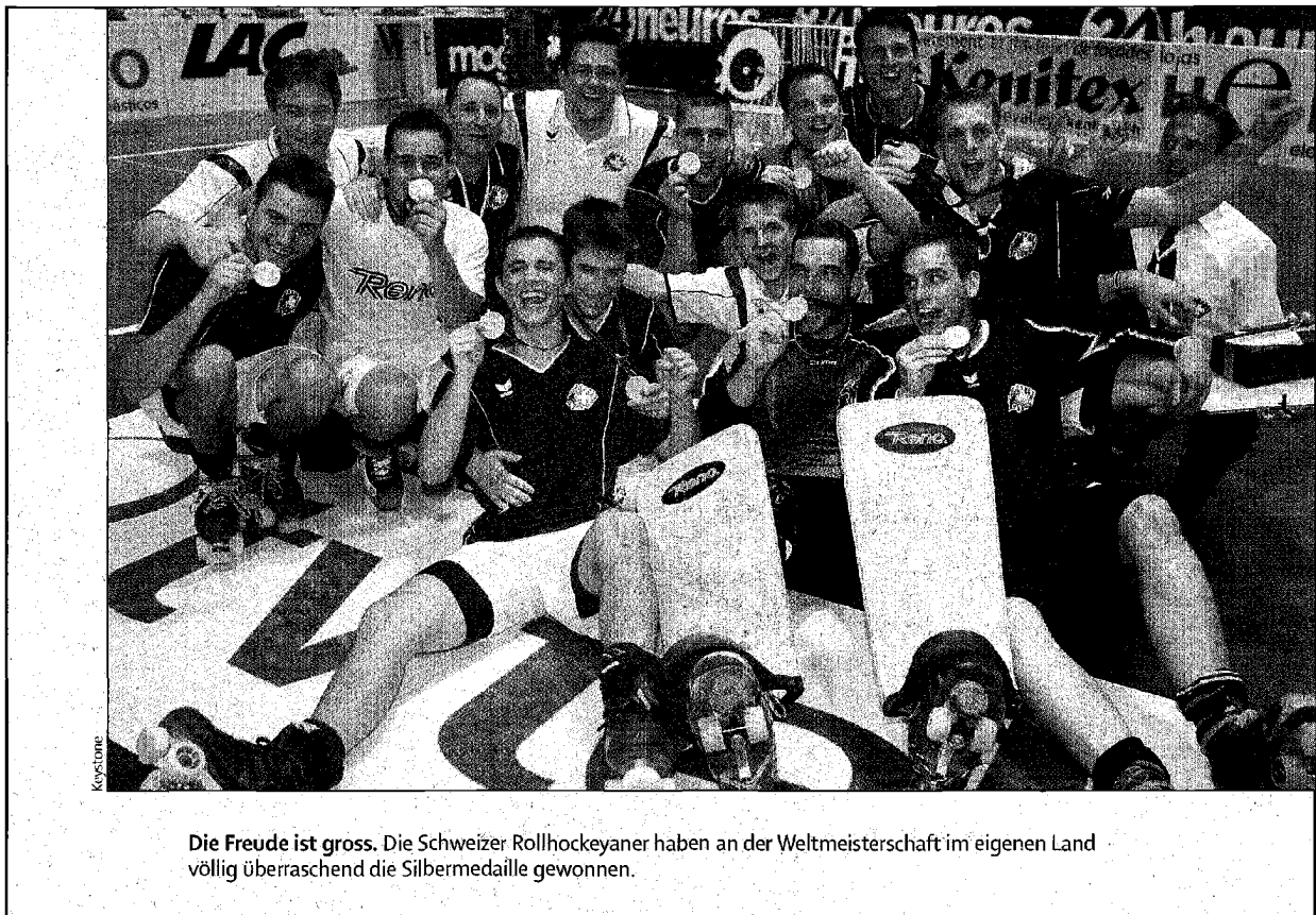
Die Freude ist gross. Die Schweizer Rollhockeyaner haben an der Weltmeisterschaft im eigenen Land völlig überraschend die Silbermedaille gewonnen.